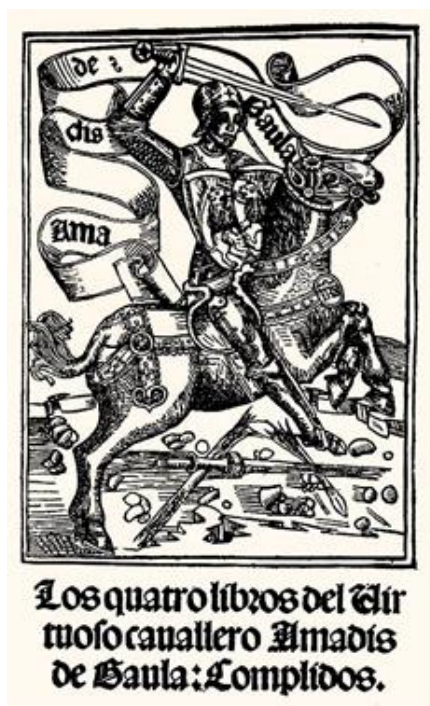
Fig. 6. Princeps de la obra de Montalvo. Imagen en línea.