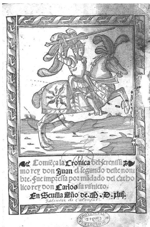
Fig. 1. Sevilla, Andrés de Burgos, 1543. Biblioteca Digital de Andalucía

(fig. 1), su portada suma a la forma del incipit propio de los manuscritos, dos elementos muy significativos a nuestro propósito. El primero, más indirecto, aparece en una justificación («fue impresa por mandato del católico rey don Carlos, su nieto») que repite con la materia histórica (todo lo sui generis que se quiera) el planteamiento alegado por Montalvo para naturalizar su ficción emparejándola con los métodos habituales en la historiografía. A modo de confirmación, un segundo elemento, más rotundo en su evidencia y más accesible a un público menos documentado, es el código no verbal de su ilustración 8 , como puede apreciarse en la edición materializada en la misma Sevilla protagonista de la conformación del género caballeresco en el mercado: