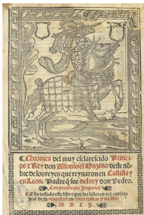
Fig. 4. Valladolid, Sebastián Martínez, 1551. Universidad de Valladolid, en línea.

La confusión de lectores con más criterio para la imagen que para el texto es perfectamente comprensible. Y lo es más aún al atender a lo reiterado de una práctica en la que se convierte en sistemático el intercambio de modelos visuales arquetípicos y la imposición de la variante caballeresca, sin freno en el anacronismo o la disfunción entre realidad e imagen, como ocurre con las del poco belicoso Juan II o en la proyección de un rostro y un tocado más propio del emperador Carlos que de su antepasado