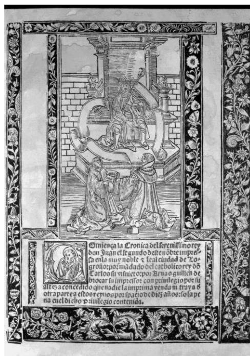
Fig. 2. Logroño, Arnao Guillén de Brocar, 1517. Universidad de Valladolid, en línea.