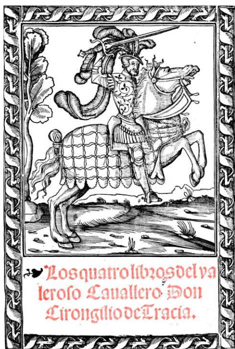
Fig. 3. Bernardo de Vargas, Don Cirongilio , Sevilla, Jacome Cromberger, 1545. Biblioteca Estatal de Baviera, en línea.

identificación, al menos entre el público menos versado, representado en la figura del Palomeque cervantino. Y sirva al propósito recordar que en su venta uno de los libros de caballerías ensalzado, el Cirongilio , compartía grabado de portada (fig. 3 y 4; Lucía Megías, 2000, 175 y ss.) con otra de las crónicas de referencia, la de Alfonso XI (con un parejo poema épico en versión de clerecía).