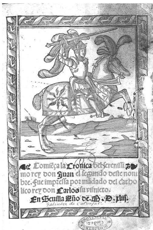
Fig. 1 Sevilla, Andrés de Burgos, 1543. Biblioteca Digital de Andalucía