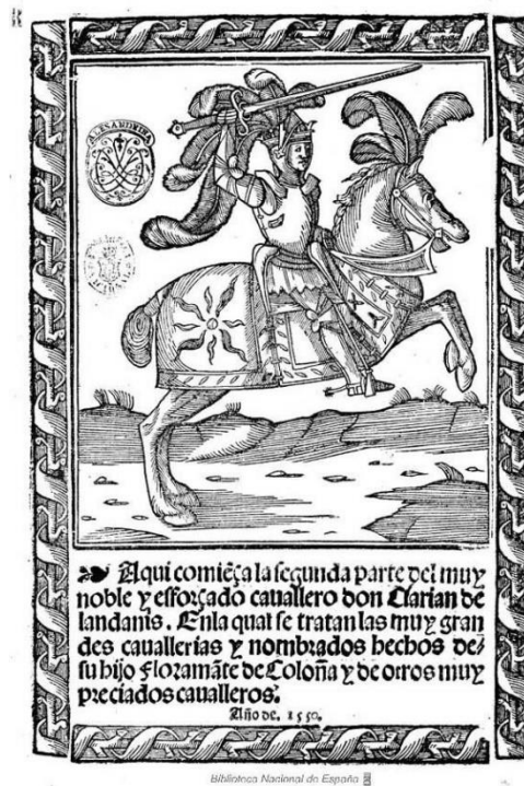
Fig. 8. Floramante de Colonia o Segunda parte de don Clarián de Landanis , Sevilla, Juan Vázquez de Ávila, 1550. Biblioteca Nacional de España, en línea.

Llevado a cabo de manera más o menos consciente, se puede considerar que a mediados del siglo XVI culmina un proceso con rasgos de sistemático orientado a la identificación de los libros de caballerías con el modelo historiográfico de la crónica, y que en el mismo los problemas de legitimación de una materia entendida como variedad in specie de la historia como género tienen cuando menos un correlato en los aspectos formales, desde los de una imagen caballerisca fundida en el crisol iconográfico de las ilustraciones de portada.