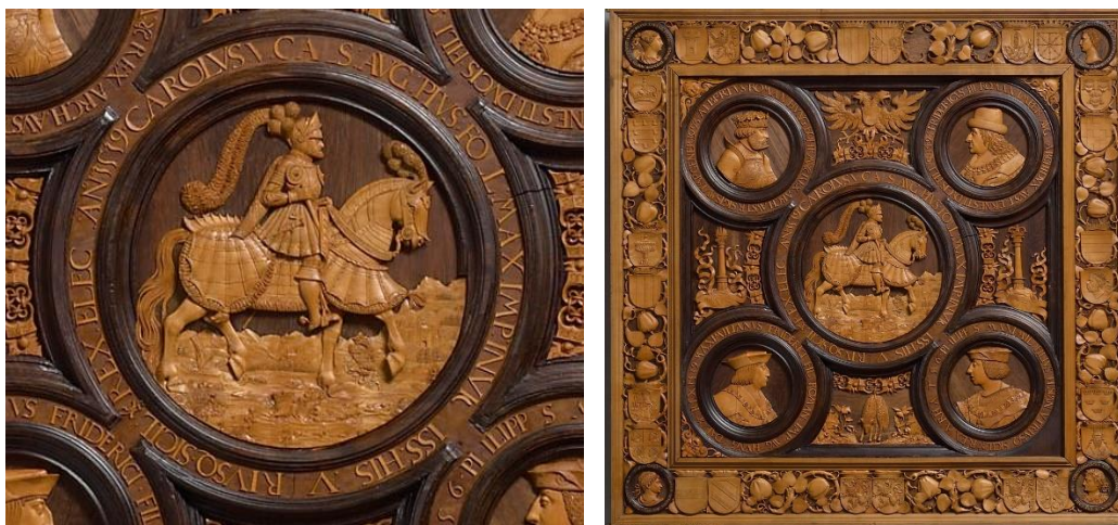
Fig. 5. «Spielbrett» (juego de mesa) de Hans Kels, en el Kunsthistorisches Museum de Viena, con detalle. Imagen en línea

medieval o su proyección ficcional. Y no está de más recordar cómo, entre los valores caballerescos de la tradición borgoñona, un programa ideológico de valor político y la contaminación con los héroes de ficción, la imagen cesárea de Carlos V se asentó en una iconografía estrechamente relacionada con la de las ilustraciones de portada de las caballerías, como se aprecia, por ejemplo, en la mesa de juego conservada en el Museo de Historia del Arte de Viena (fig. 5), con una imagen paralela a la de la Crónica de Juan II (fig. 1) o el Floramante (fig. 8), con la única diferencia de que el emperador no blande la espada en gesto de batalla.