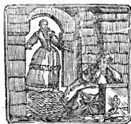
Figura 20: Resumen del Cid. Comparación entre las ediciones 1767 y 1781

Tuvo su esclarecido origen nuestro Cid Campeador, D. Rodrigo Diaz de Vivar, del tronco illustre, y Linage honroso de Lain Calvo, Juez primero de Castilla, que baxando su descendencia de tan clarificada rama nobilissimo varon Don Diego de Laynez, padre del Cid, tuvo el Cid por hijo á nuestro D. Rodrigo Diaz de Vivar, que por ser Señor de la Villa de Vivar, fue llamado de esta manera: y asimismo fue llamado Cid, que es lo mismo que Batallador, y Campeador, por las muchas batallas que ganó á los Moros. Quando murió el padre de este insigne Heroe D. Diego Laynez, llevó para su hijo el Rey D. Sancho de Castilla á Rodrigo Diaz de Vivar, crióle, y le hizo caballero; arrematado al estilo de aquellos tiempos.