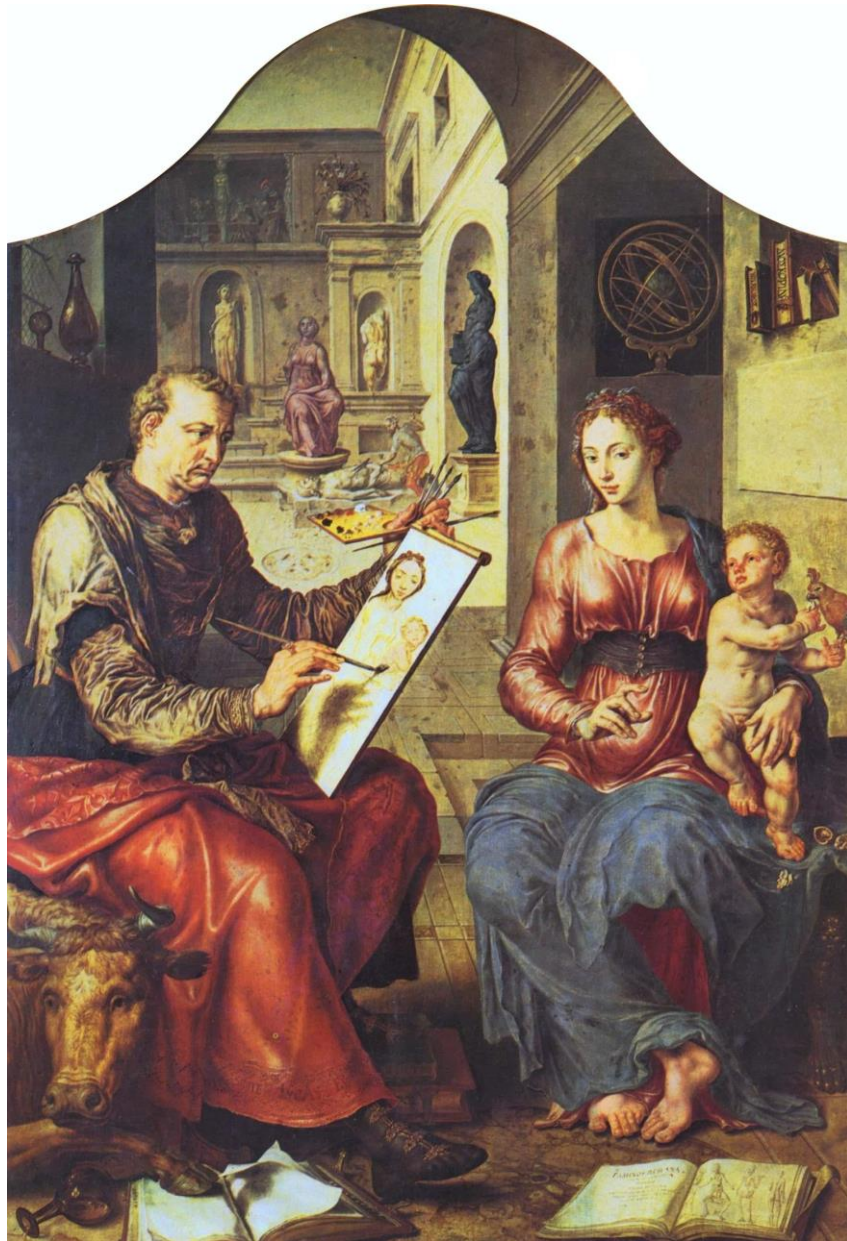
Figura 5: Maarten van Heemskerck, San Luca dipinge la Vergine (ca. 1545).