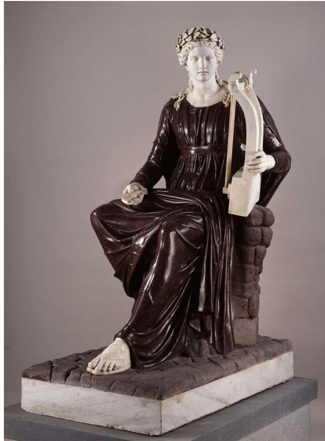
Figura 5: Apollo citharedo (II sec. d.C.), Napoli, Museo Archeologico Nazionale.

variante cinquecentesca dell'antica spoliatio aegyptios e di ricostruzione artistica a lo divino 34 .