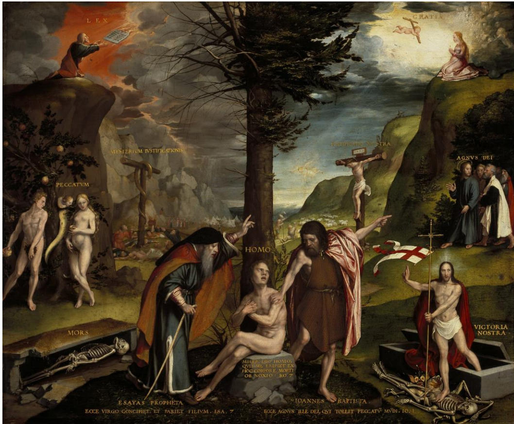
Figura 3: Hans Holbein, Allegoria del Vecchio e Nuovo Testamento (1530).

Così, a poco a poco, ogni momento del pellegrinaggio, come il sogno di Periandro che pare evocare l'affresco estense, troverebbe una sua ragione coerente e allo stesso tempo screziata, rispetto a una ragione unitaria e allegorica d'insieme, che invece lascerebbe dietro sé inspiegati troppi dettagli suggestivi che non possono essere sprecati. Il sogno raccoglie infatti una delle tante profezie contenute nel romanzo; essa è affidata alla seconda parte dell'allegoria trionfale, che fa da contrappeso a quella del carro di