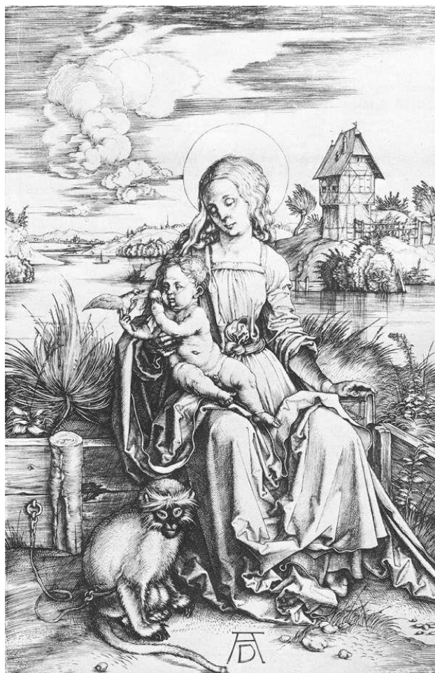
Figura 2: Albrecht Dürer, La Madonna della scimmia (ca. 1498).

imperfetta; in Italia la scimmia ha quasi sempre un valore simbolico legato al mondo della sfrenatezza, della follia o del puro dato esotico 24 .