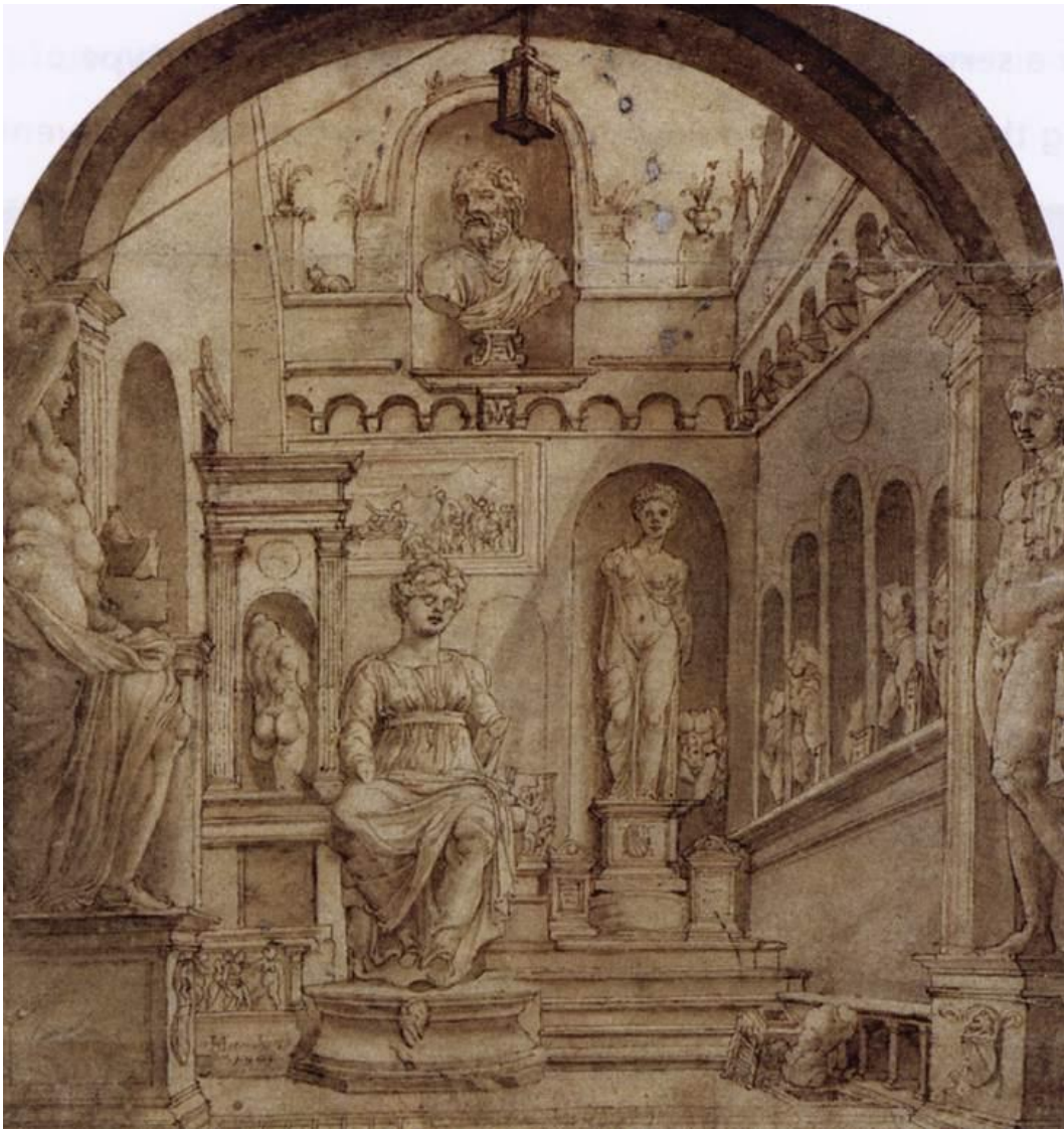
Figura 4: Maarten van Heemskerck, Sculpture Court of the Casa Sassi in Rome (1532-1537).